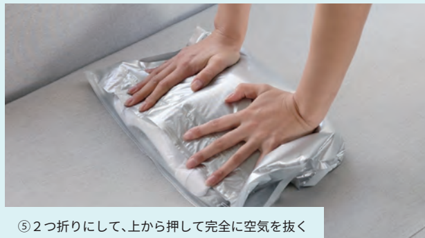
⑤ 2つ折りにして、上から押して完全に空気を抜く