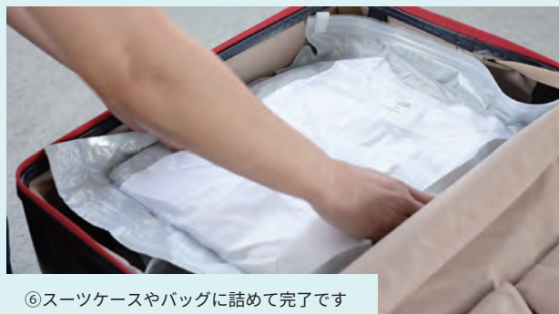
⑥ スーツケースやバッグに詰めて完了です